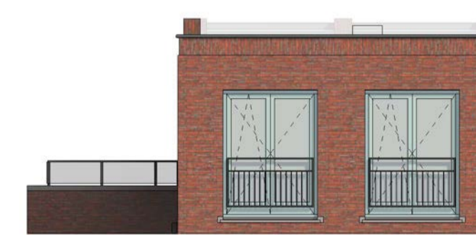
achtergevel schaal 1 : 100