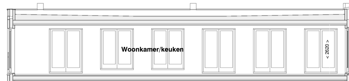
doorsnede A-A schaal 1 : 100