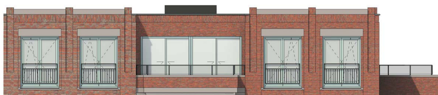
voorgevel schaal 1 : 100