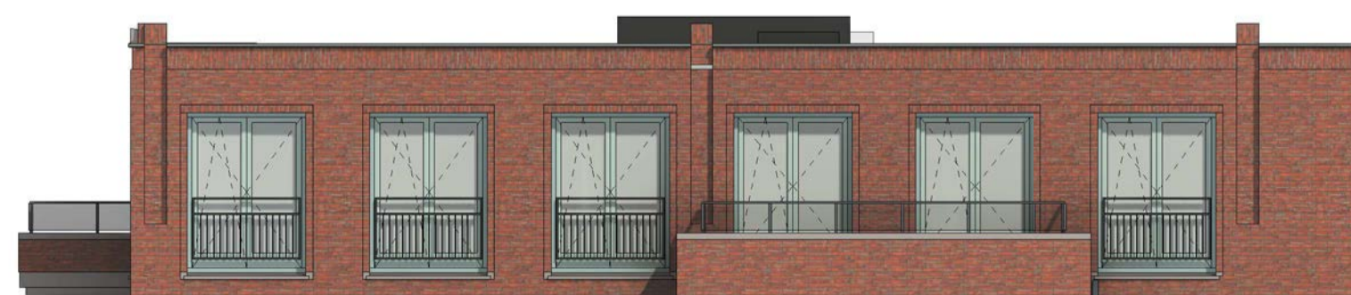
zigevel schaal 1 : 100