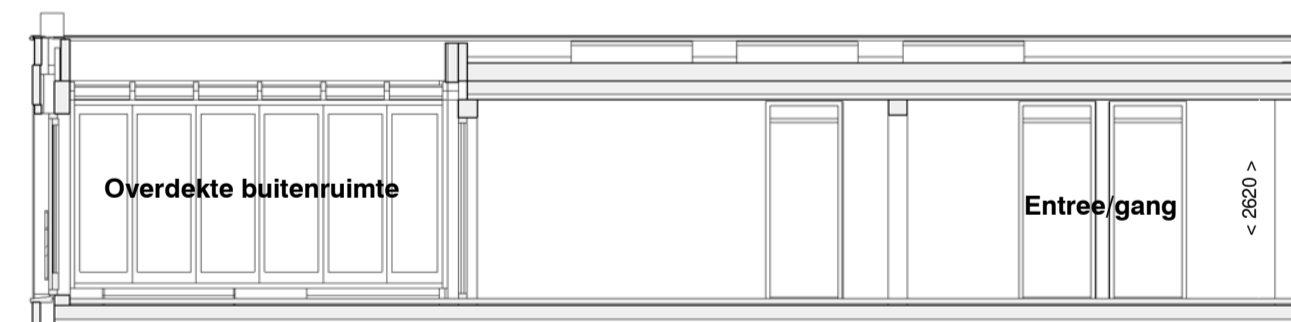
doorsnede B-B schaal 1 : 100