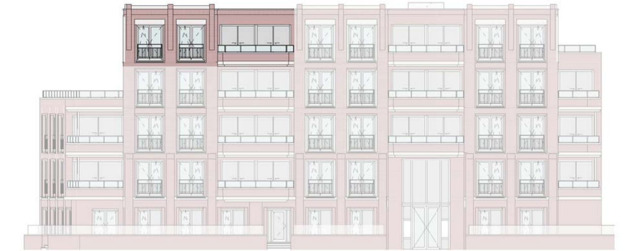
geveloverzicht schaal 1 : 250