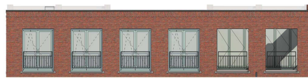
achtergevel schaal 1 : 100