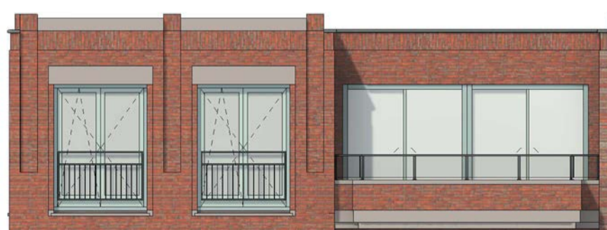
voorgevel schaal 1 : 100