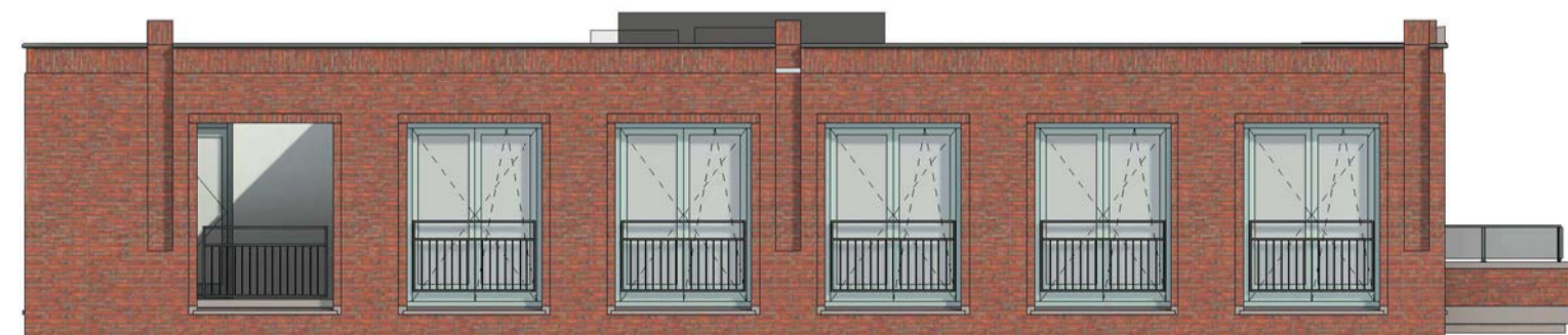
linkerzijgevel schaal 1 : 100