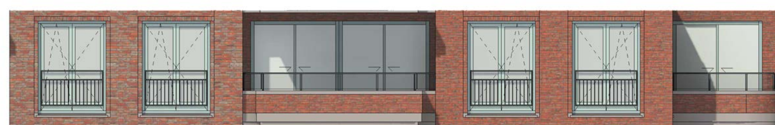
voorgevel schaal 1 : 100