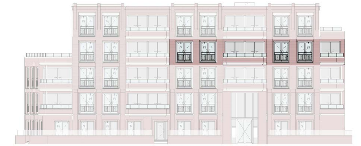
geveloverzicht schaal 1 : 250