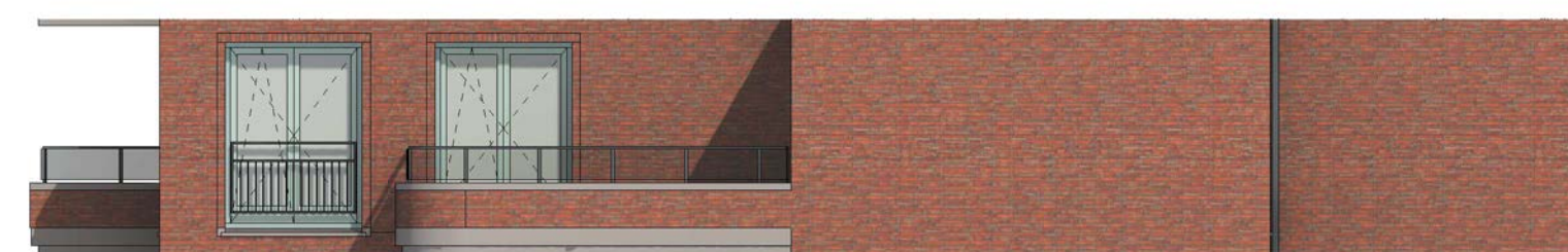
zijgevel schaal 1 : 100