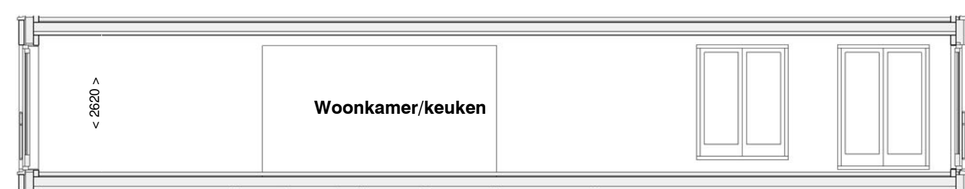
doorsnede A-A schaal 1 : 100