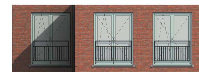
achtergevel schaal 1 : 100